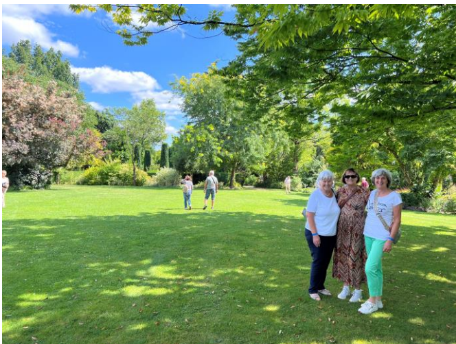
Spaziergang durch den Garten

Der interessante Seniorenausflug wurde auch dank eines grosszügigen Beitrags aus dem KKL-Fonds ermöglicht. Dem Kernkraftwerk Leibstadt sowie der Harry Suter Ferienreisen GmbH, Würenlingen, wird an dieser Stelle herzlich gedankt.