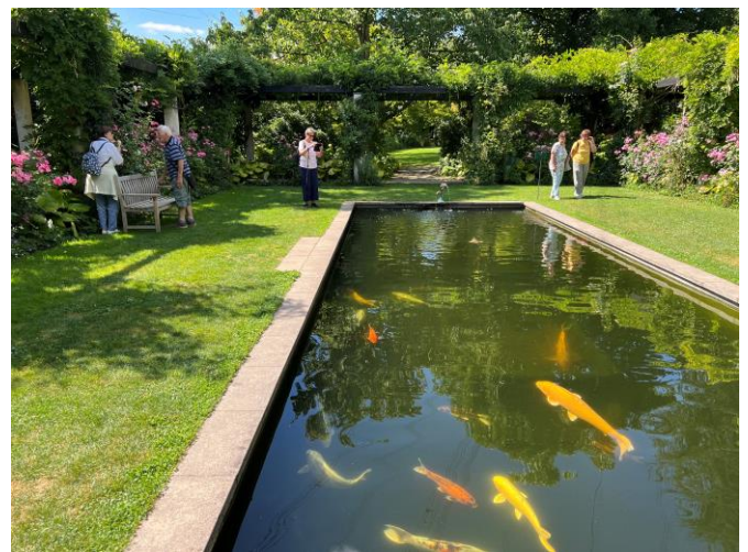
Schöner Teich mit Koifischen