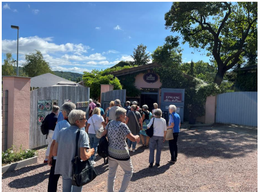
Seniorenausflug vom 20. August 2024 (weitere Impressionen auf Seite 4)

Montag: 08.30 – 11.30 Uhr / 14.00 – 16.30 Uhr Dienstag: 08.30 – 11.30 Uhr / 14.00 – 18.00 Uhr Mittwoch: ganzer Tag geschlossen Donnerstag: 08.30 – 11.30 Uhr / 14.00 – 16.30 Uhr Freitag: 07.00 – 14.00 Uhr (durchgehend)