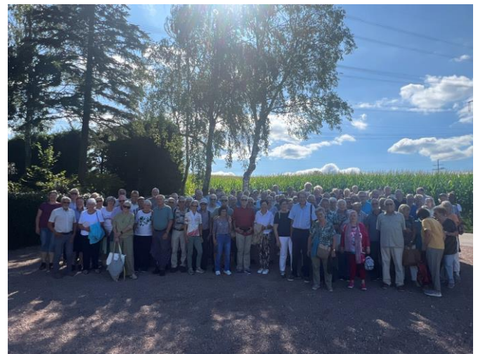
Gruppenfoto mit allen Beteiligten